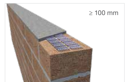
Murfor® Compact E-70