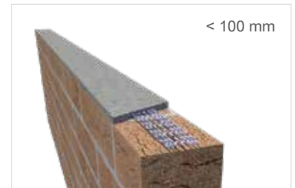
Murfor® Compact E-35