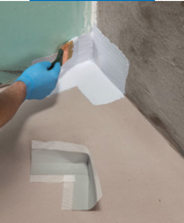
Einbau einer Mapeband PE 120 Innenecke mit Mapegum WPS