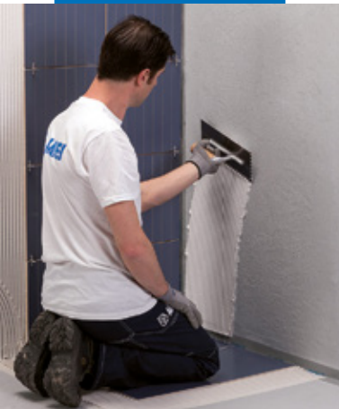
Ansetzen des Belags mit Keraflex Maxi S1