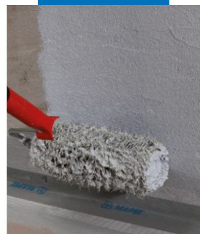
Auftragen von Mapegum WPS mit einer Rolle