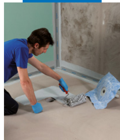
Einbau eines Bodenablaufs mit Mapegum WPS