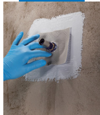
Einbau einer Mapeband PE 120 Wanddichtmanschette mit Mapegum WPS

Mapegum WPS kann im frischen Zustand mit ausreichend Wasser leicht von Arbeitsgeräten und Oberflächen entfernt werden.