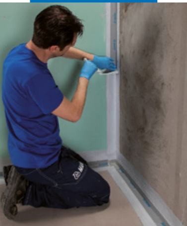
Einbau Mapeband PE 120 mit Mapegum WPS