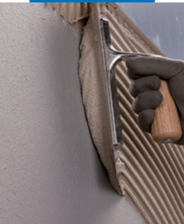
Ansetzen des Belags mit Ultramastic III

www.mapei.com MAPEI Technologie, auf die Sie bauen können.