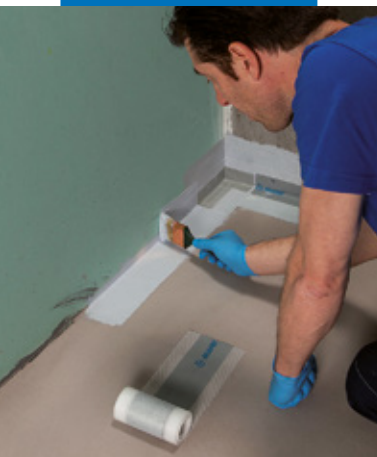
Einbau Mapeband PE 120 mit Mapegum WPS