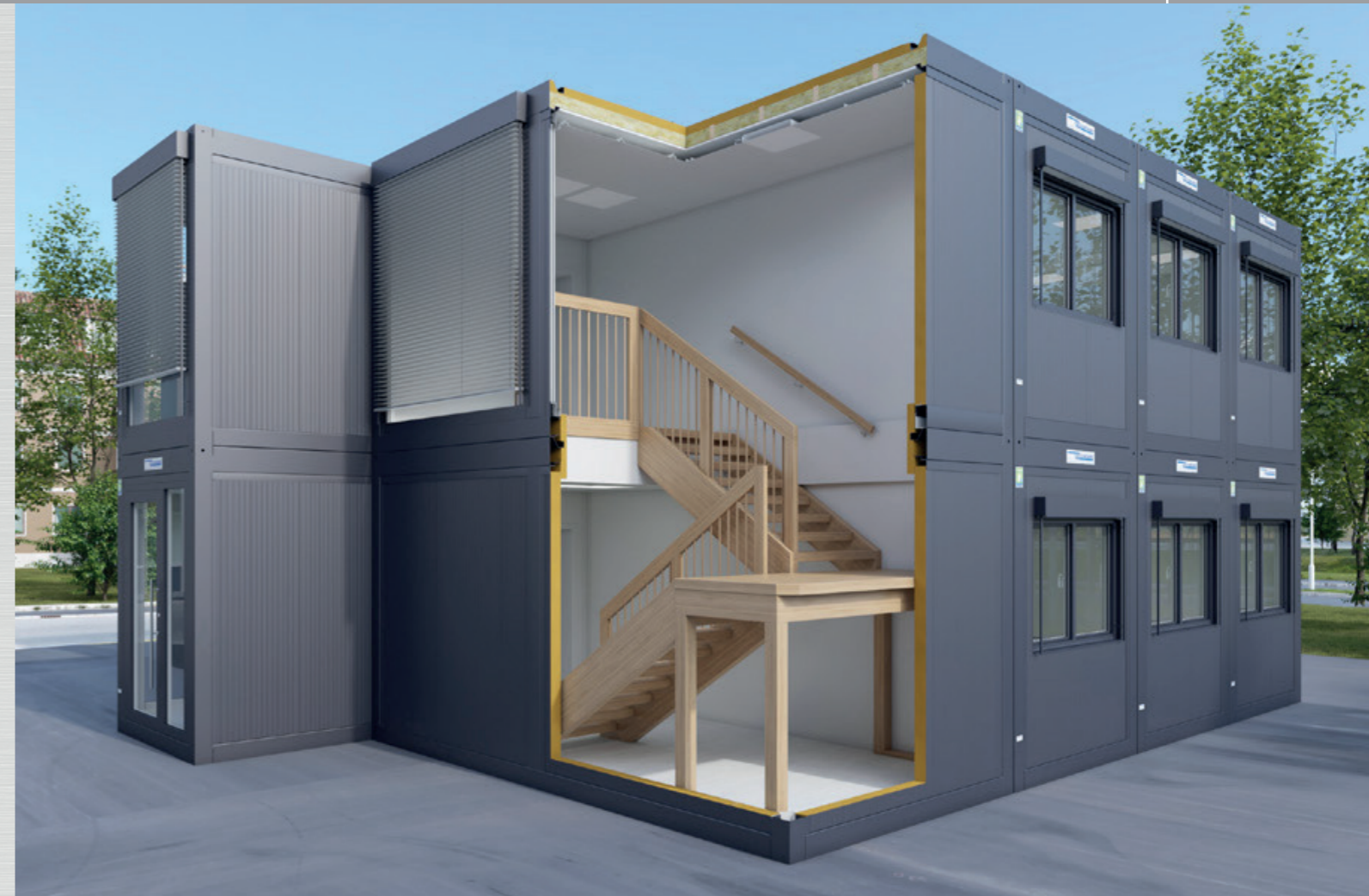
Haute isolation thermique conforme aux normes