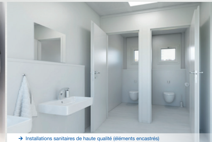
→ Installations sanitaires de haute qualité (éléments encastrés)