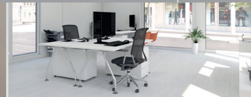
→ Pièces lumineuses grâce aux vitrages complets