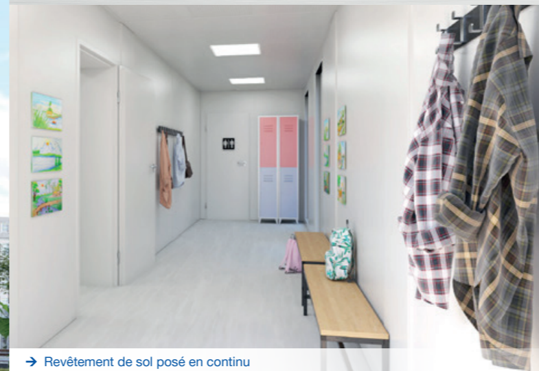
→ Revêtement de sol posé en continu