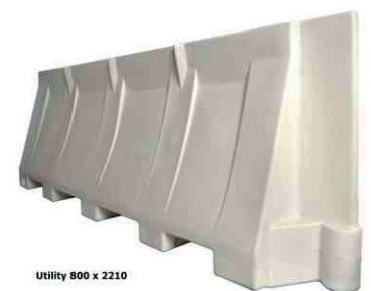
Utility 800 x 2210