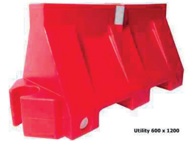
Utility 600 x 1200

Dimensions: 2210(l) x 460(b) x 800(h) mm Longueur utile: +/- 214 cm Capacité: 128 liter Poids vide: 22 kg Poids rempli à l'eau: 150 kg