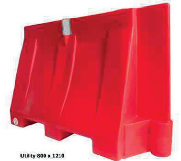
Utility 800 x 1210